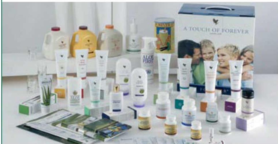
A katalógusban bemutatott egységdobozok képei csak illusztrációk!